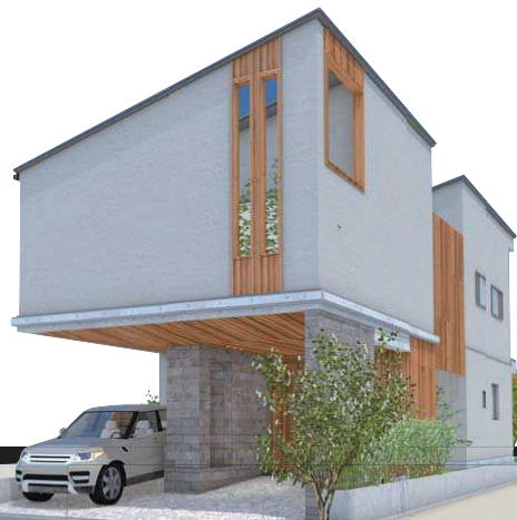
プラン建物完成予想図につき、実際とは異なる場合がございます。