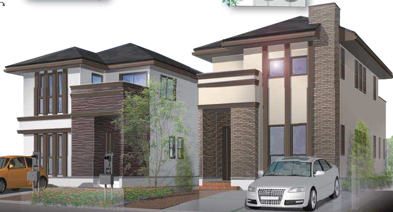
プラン建物完成予想図につき、実際とは異なる場合がございます。