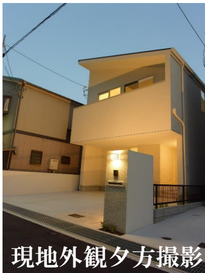
現地外観夕方撮影