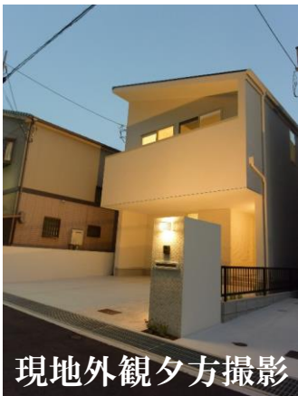
現地外観夕方撮影